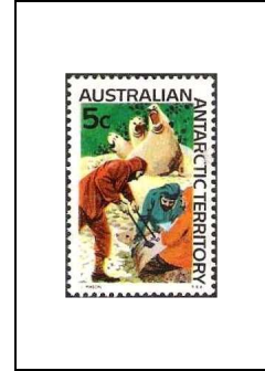
Marquage des phoques