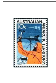
Mesure du vent