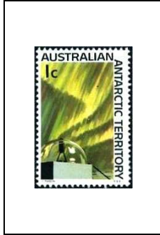
Aurore et caméra